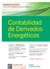
Contabilidad de Derivados Energéticos Madrid, 17 de Abril de 2013