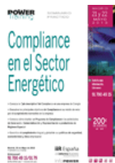
Compliance en el Sector Energético Madrid, 21 y 22 de Mayo de 2013