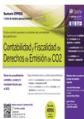
Contabilidad y fiscalidad de Derechos de Emisión de CO2 Madrid, 17 de Abril de 2013